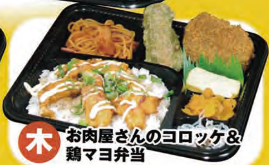
木 お肉屋さんのヨロツケ & 鶏マヨ弁当