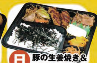
日 豚の生姜焼き & 一口カツ弁当