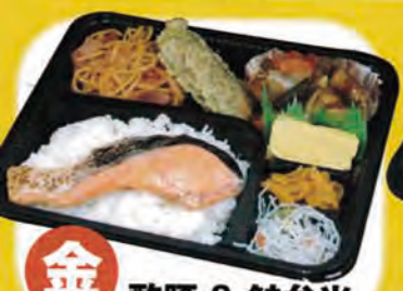
金 酢豚 & 鮭弁当