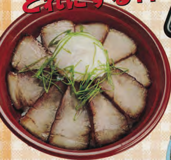
自家製 炭火焼 炙りチャーシュー丼 702円 マヨネーストッピング 35円