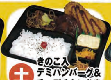
土 きのこ入 デミハンバーグ & チーズチキン弁当