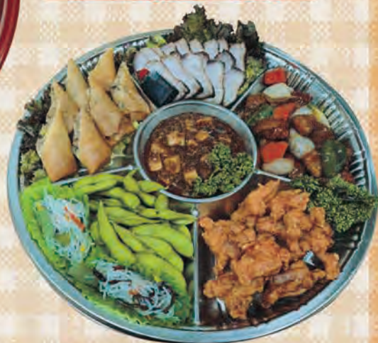
自家製炭火焼炙りチャーシュー、酢豚、 唐揚げ、春巻きなど 中華オードブル (販売終了)