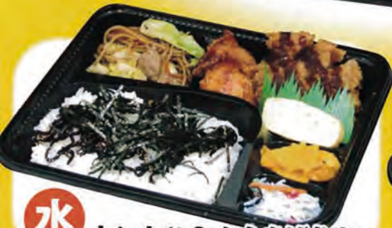
水 トンカツ & からあげ弁当