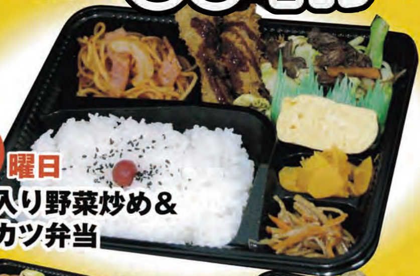
火 曜日 牛肉入り野菜炒め& 一口カツ弁当