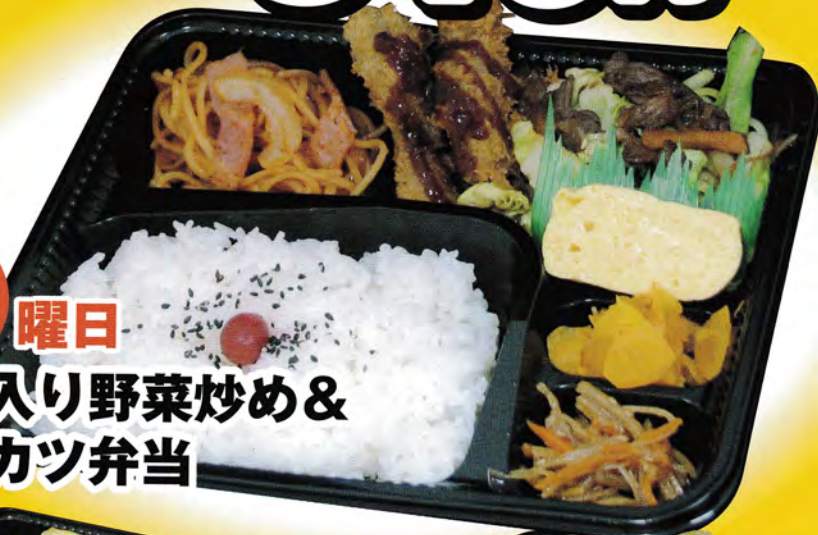
火曜日 牛肉入り野菜炒め& 一口カツ弁当