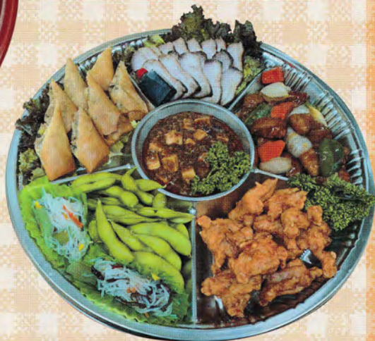
自家製炭火焼炙りチャーシュー、酢豚、 唐揚げ、春巻きなど