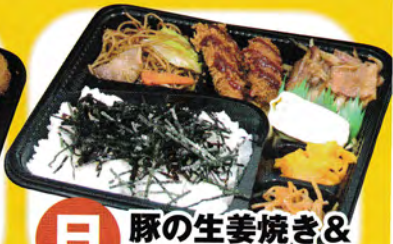
日 豚の生姜焼き& 一口カツ弁当