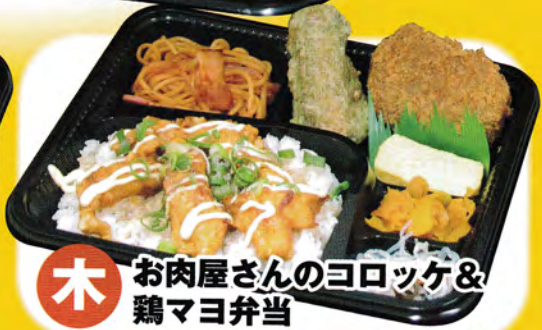
木 お肉屋さんのヨロツケ& 鶏マヨ弁当