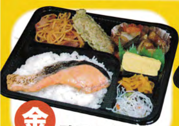
金 酢豚 & 鮭弁当