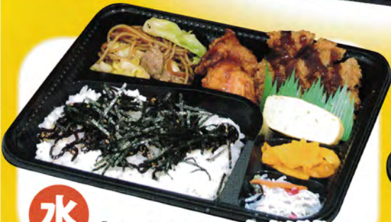
水 トンカツ & からあげ弁当