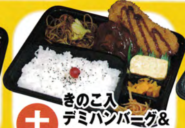
土 きのこ入 デミパンパニグ& チーズチキン弁当