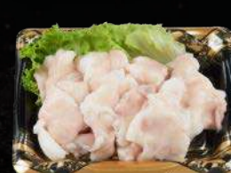
和牛ショウチョウ