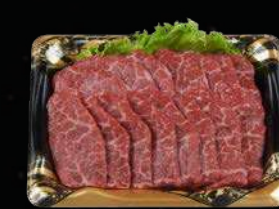
国産牛網焼き用肩バラ