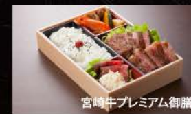
宮崎牛プレミアム御膳