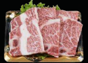
国産牛骨付き三角バラ